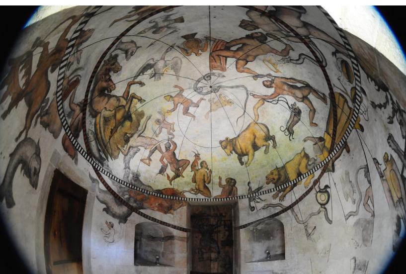
Voûte céleste de Saint-Jean-de-Chépy à Tullins